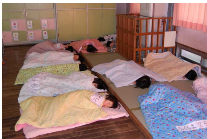
○睡眠実験の様子と結果のグラフ

厳選された 15 曲に対して、調布市の保恵学園保育所の協力を得て、2 - 3 歳の園児さん 14 名に行動計をつけ、計 54 回睡眠実験を行いました。床についてから寝るまでの時間は、音楽なしで平均 23 分でした。15 曲を「魅力的で音楽に耳を傾けたくなる曲」、「リラックスして、こころ穏やかになる曲」、「静かに眠りへ導く曲」に分類し、1 曲目は魅力的な曲、2 曲目はリラックスできる曲、3 曲目は眠りへ導く曲とし、3 曲を 1 セットとして 5 セット用意し実験を行いました。実験の結果、1 セットは寝付くまでの時間が 26 分と長かったため削除し、残り 4 セットをアルバムに収録しました。アルバムの 1 曲目から 3 曲目のセットは 16 分で寝付くことができました。赤ちゃんが聞いても、子供が聞いても、大人が聞いても心安らぐできばえになっています。